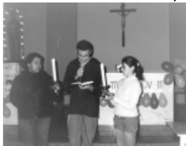
Pela primeira vez realizada na Par. Nsa. Sra. das Graças