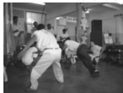
Palestrantes entram na roda de capoeira