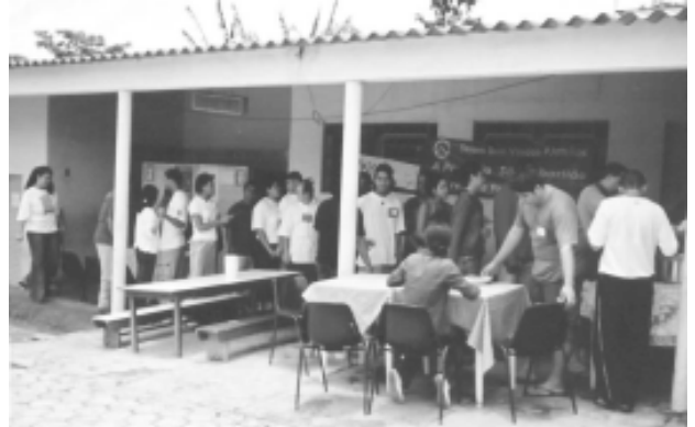
Almoço da Assembléia de 2003, Par. São Sebastião - Mogi